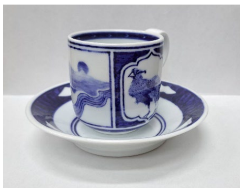
「カップアンドソーサー」(陶芸)